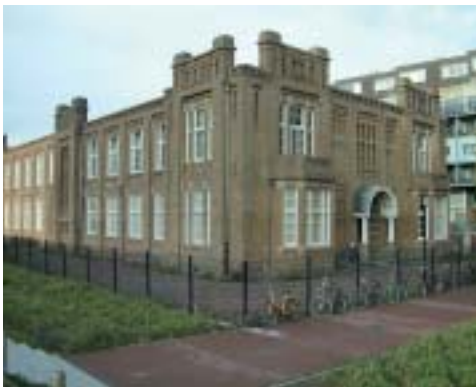
Voormalig hoofdkantoor van de Koninklijke Nederlandsche Lloyd (1917).

Juist in die tijd kenterden de opvattingen over het belang van het industrieel erfgoed. Door hun gerekte bestaan konden de havengebouwen ervan meeprofitieren. Nu herken je de invloed van de eerste bewoners nog aan de culturele bestemming van veel gebouwen en de vele artistieke bedrijven in het gebied. Want