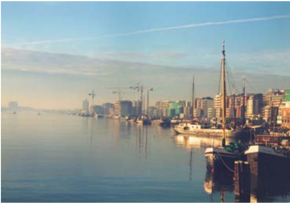
Java-eiland in aanbouw, 1995.

maakte voor container- en bulktransport, waarvoor aan de westkant van Amsterdam een havengebied ingericht werd. De passagiersvaart maakte geleidelijk plaats voor de veel snellere luchtvaart.