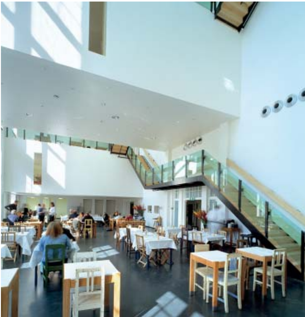
Restaurant Snel, Lloyd Hotel.