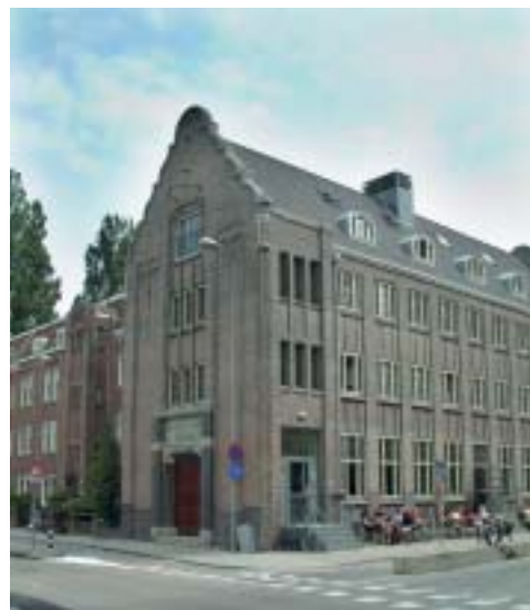
Ontsmettingsgebouw (1923) naast het Lloyd Hotel.

kunst trekt kunst: langs de IJ-oeveren is een cultuurgordel aan het ontstaan. Het Oostelijk Havengebied is nu een geheel nieuwe stadswijk met verspreid door het gebied, als bakens van de tijd, de gerenoveerde havengebouwen. Ze kregen een nieuwe functie, voor horeca, bewoning, bedrijfsruimten en ateliers, als school of compleet buurtwinkelcentrum. Het OHG beleeft zijn tweede bloei-periode. Het wordt jaarlijks door tienduizenden toeristen bezocht. Ook Amsterdammers zelf nemen steeds vaker een kijkje in deze bijzondere wijk in het water. En dan nog loopt het gebied een maal per vijf jaar vol met miljoenen bezoekers aan Sail, een zinderende totaalshow van alles wat vaart. Het Oostelijk Havengebied blijkt van grote economische waarde voor recreatie en toerisme. En dat heeft alles te maken met hergebruik en herbestemming.